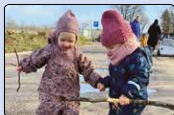
Nyt fra Hanved Daginstituttio