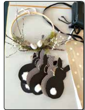
Produkte des Osterbastelns.

Seit Mitte Oktober 2023 ist der Kulturverein Jarplund um über 80 Mitglieder gewachsen. Den bisherigen Rekord der Mitgliederzahlen aus 2017 von 171 Mitgliedern konnte schon Ende 2023 geknackt werden. Nun sind es bereits über 200 Mitglieder. Das zeigt immer wieder,