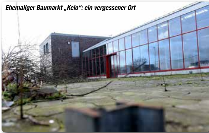
Ehemaliger Baumarkt „Kelo“: ein vergessener Ort

Es tut sich mal wieder etwas in der Handewitter Ortsmitte. Nachdem die ersten Wohnobjekte der Raiffeisenbank und das neue Ärztehaus fertiggestellt worden sind, rückten die Baumaschinen nun für den nächsten Hochbau an: das Bürgerhaus entsteht. Am 12. März stellten Investor, Architekt und Bürgermeister das Konzept für den zukünftigen Sitz der Gemeindeverwaltung vor. In den Neubau werden auch Räumlichkeiten für die Allgemeinheit integriert.