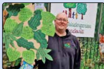
Abschied im Waldkindergarten