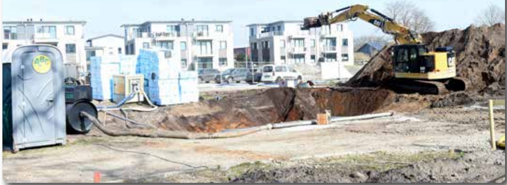
Anfang März: Baustart für das Bürgerhaus.

GB GEBR. BECKMANN IHR PARTNER FÜR BAD & HEIZUNG