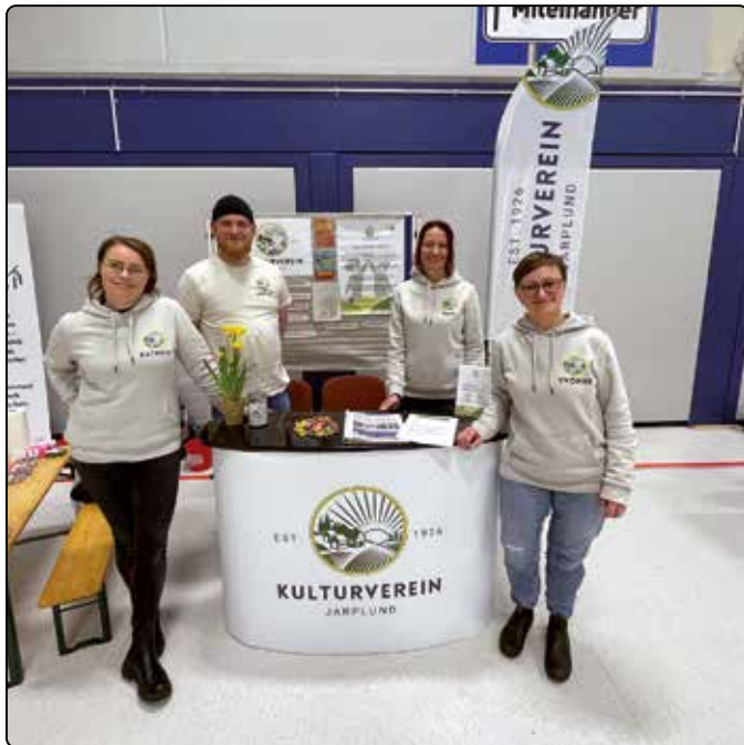
Stand auf dem Gemeindefest.

Am 10. Februar lud die Gemeinde Handewitt zum Bürgerempfang in die Wikinghalle ein. Der Kulturverein Jarplund folgte der Einladung sehr gerne. Nun kamen endlich die neuen Messetresen, die Beachflag und die Vereinspullover zum Einsatz. Ei-