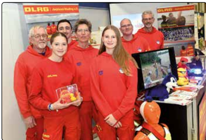
DLRG: Die Vereine präsentierten sich.