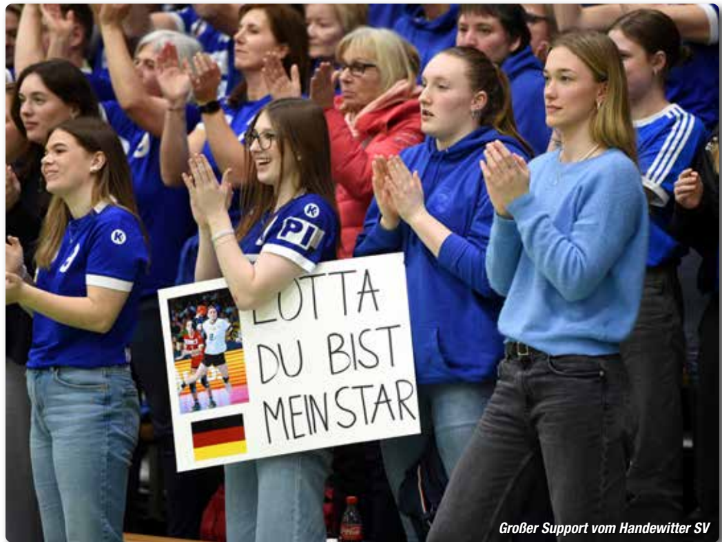
Großer Support vom Handewitter SV

Seit mehr als 30 Jahren reinigen wir Heizöltankanlagen – sauber zuverlässig, fachgerecht!