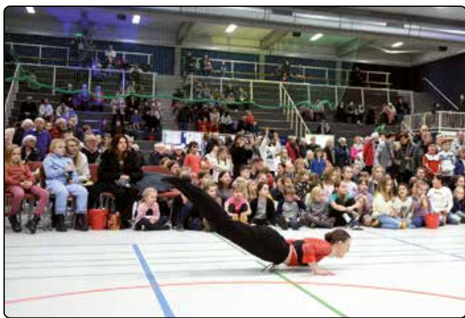
Großer Andrang: Ballettschule Harrislee.

In anderen Gemeinden stehen die Neujahrsempfänge hoch im Kurs, in Handewitt zieht man erst im Februar mit dem Gemeindefest nach. Das Organisations-Team, das Kommunalpolitik und Gemeindeverwaltung besetzten, durfte sich in der Terminierung bestätigt fühlen. Denn diese Kombi-Veranstaltung aus Bürgerempfang, Vereinsmesse und Kinderfest fand einen großen Anklang.