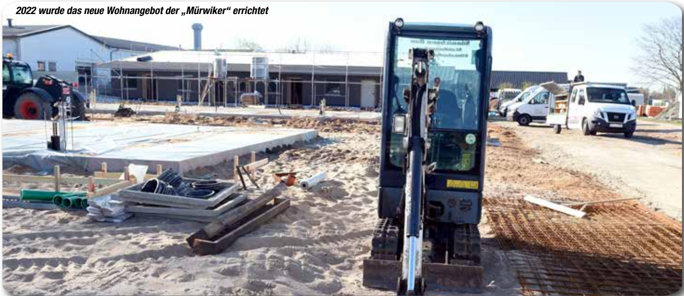
2022 wurde das neue Wohnangebot der „Mürwiker“ errichtet

Die Mürwiker GmbH betreibt Werkstätten und unterhält Wohnangebote für Menschen mit Behinderung in Flensburg, Harrislee, Niebüll, Schafflund, Munkbrarup und seit dem letzten Jahr auch in Handewitt. Der Wohnpark mit insgesamt 26 Apartments und Gemeinschaftsräumen, verteilt auf acht Gebäude, wurde von Gerald Müller (M&M Grundstücksgesellschaft) gebaut. Die Bewohnerinnen und