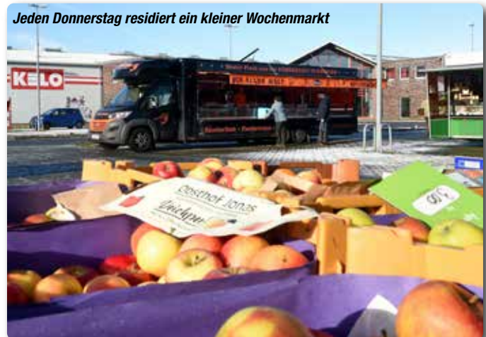
Jeden Donnerstag residiert ein kleiner Wochenmarkt