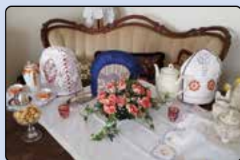
Platt-Snackers im Dorfmuseum