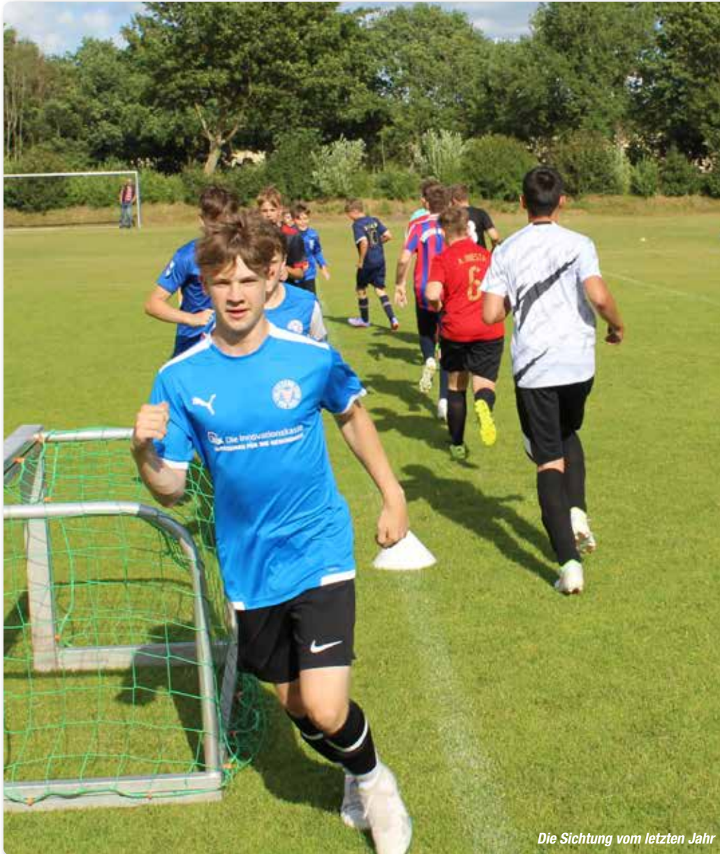
Die Sichtung vom letzten Jahr

Spieler-Akquise im Blick. Diese vier Trainer verfolgen gemeinsam das gleiche Konzept, wollen eine Mannschaft recht hoch qualifizieren und den Unterbau mit der C2 in der Kreisliga starten lassen. Dazu sichten sie in einem Sondertraining nach den Osterferien die Nachwuchsspieler im eigenen Verein und auch interessierte Kicker, die bereits aus Nachbarvereinen angefragt haben.