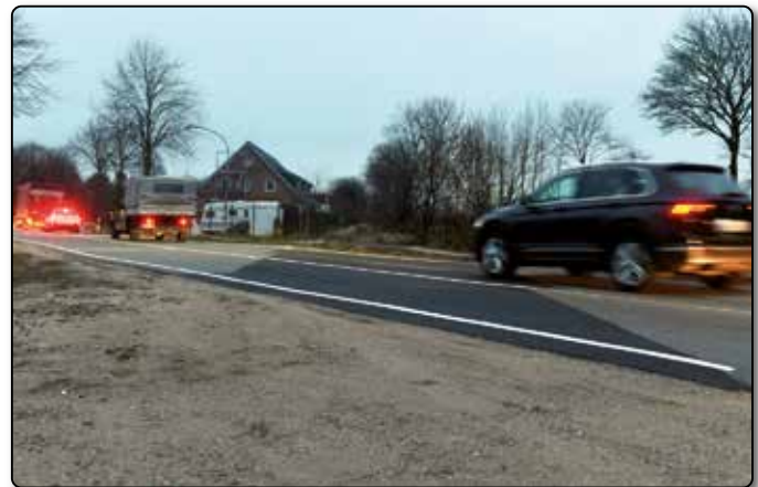
Ein Bahnübergang ist verschwunden.