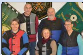
Erfolgreiche Handewitter Schützen