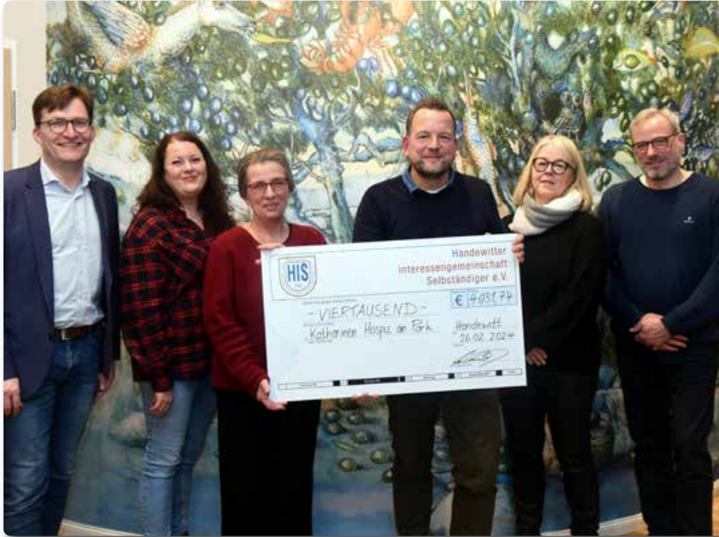
Der H.I.S. Vorstand überreicht die Spende an die Hospiz-Geschäftsführung.

Die Jahreshauptversammlung mit Grünkohlessen ist stets der Januar-Höhepunkt bei der Handewitter Interessensgemeinschaft Selbständiger (H.I.S.).