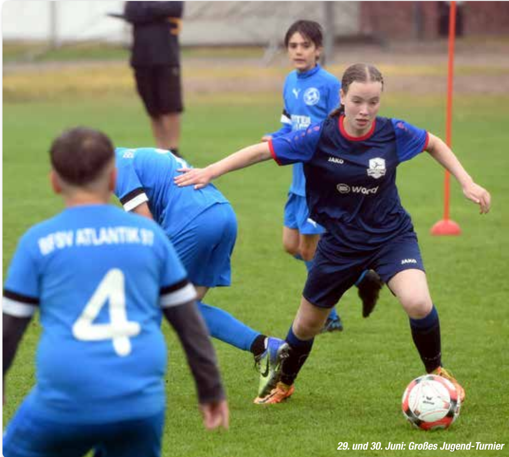
29. und 30. Juni: Großes Jugend-Turnier