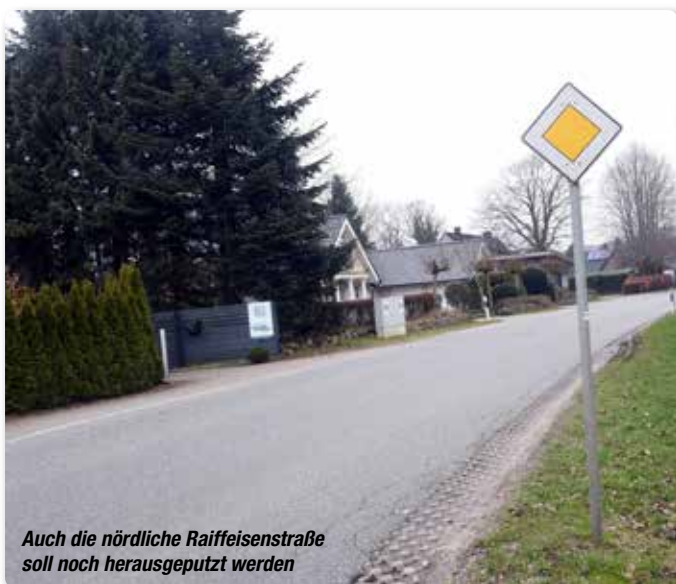
Auch die nördliche Raiffeisenstraße soll noch herausgeputzt werden

• Satelliten • Antennen • Anbau • Reparatur