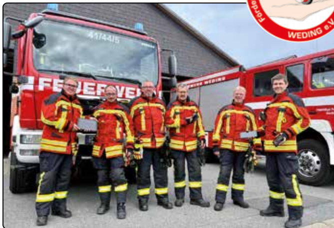
Lizenzkosten für das ergänzende Einsatzmeldesystem (EMS)