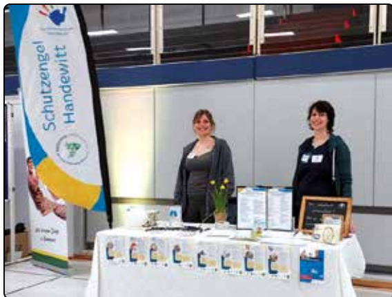
Stand auf dem Gemeindefest.

Ebenso wird eine monatliche Übersicht der Veranstaltungen der Vereine auf der Gemeinde-Homepage (unter „Gemeindeleben-Veranstaltungen“) vorbereitet und auf Facebook veröffentlicht.