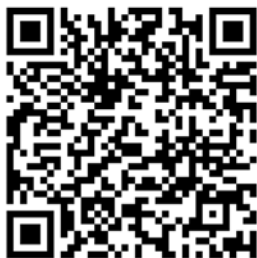
Angebote für Altersgruppe 60+

gemeinsamen Stand vertreten und konnte wieder ein paar Dankeschön-Schokoladen verteilen. Vor allen die Übersichten der Angebote der verschiedenen Vereine und Gruppen für Kinder/Jugendliche sowie für die Altersgruppe „60 plus“ sind sehr gut angekommen. Sie sind immer aktuell auf der Gemeinde-Webseite unter „Gemeindeleben-Freizeitangebote“ zu finden. Auch eine Version für Erwachsene ist in Arbeit.