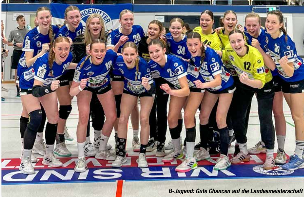
B-Jugend: Gute Chancen auf die Landesmeisterschaft