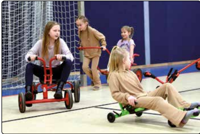
Spielwiese für Kinder.