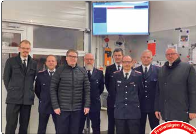
Bildschirm für das ergänzende Einsatzmeldesystem

Eine starke Feuerwehr braucht vor allem eines: Nachwuchs. Und eben weil dieser Nachwuchs so wichtig ist, wird auch die Jugendfeuerwehr Weding vom Förderverein gestärkt. So steht der Jugendfeuerwehr Weding zum Beispiel ein jährliches Taschengeld zur freien Verfügung. Die Vorteile einer Mitgliedschaft: