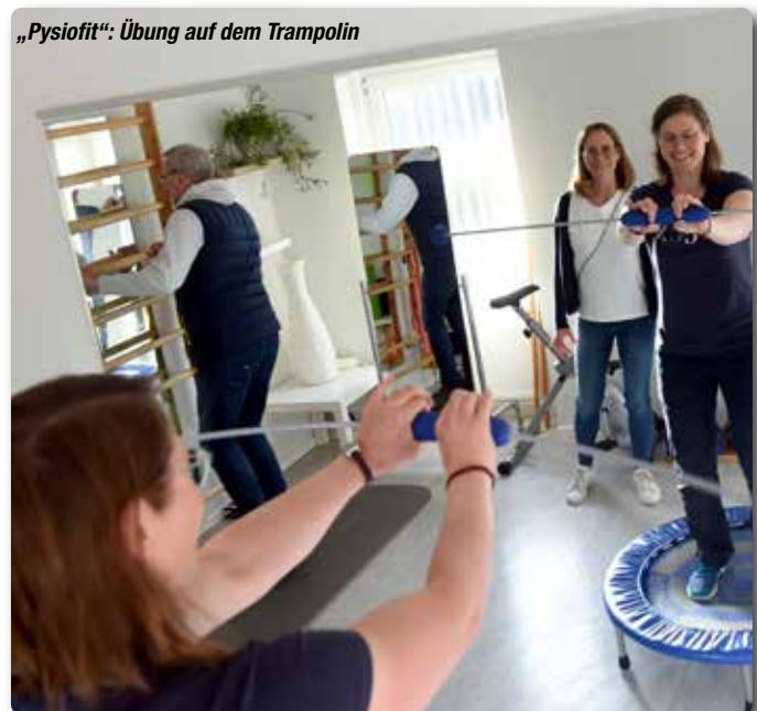
„Pysiofit“: Übung auf dem Trampolin

Zurück am Wiesharder Markt duftete bereits der Grill. Auf der Terrasse der „Praxis für Physiotherapie Handewitt“ folgte der gesellige Teil. Unter allen Rallye-Teilnehmern wurden beim abschließenden „Klönshack“ attraktive Preise verlost. Und wer wollte, konnte zur Verdauung den neuen Gerätepark der Praxis testen. (ki) ■