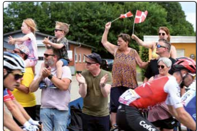
Dänische Begeisterung.

Das kleine Nest, in dem nur 535 Einwohner registriert sind, erfüllte meine Erwartungen: ein dänisches Volksfest. Die beiden Straßenränder waren ein endlo-