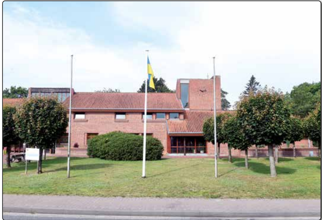
Krieg in der Ukraine: Folgen auch für Handewitt.