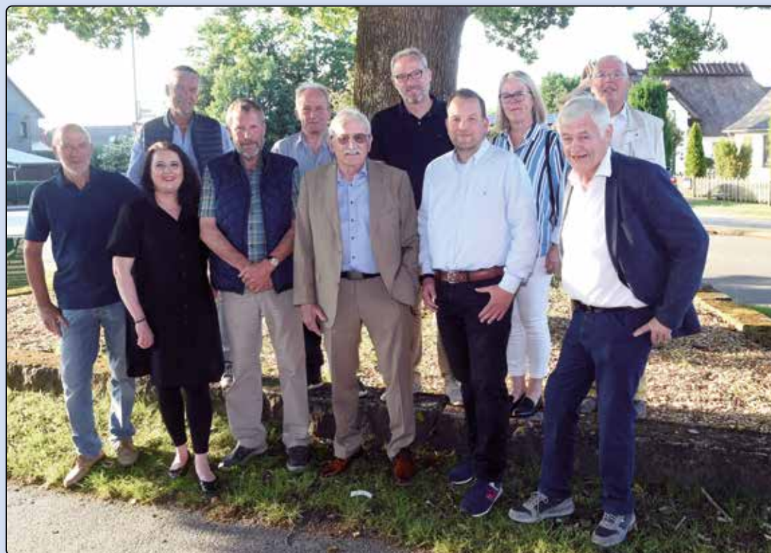
H.I.S.: 1992 – Auf den Spuren der Gründung