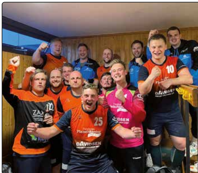
Ein Foto vom letzten Heimspiel, dem Derbysieg gegen Hürup 2. Da wurde noch vom Klassenerhalt ausgegangen und der Jubel war entsprechend groß.

Nach mehreren Wochen der Unsicherheit über eines Verbleibes in der SH-Liga. Ist es nun traurige Gewissheit. Der Handballverband hat nun entschieden, dass wir trotz des Status eines Nicht-Regelabsteigers in der kommenden Saison wieder in der Landesliga antreten müssen. Dieses Urteil hat viele von uns im ersten Moment überrascht, da wir mit unserer sportlichen und kämpferischen Leistung definitiv in die SH-Liga gehören, was uns auch von vielen anderen Vereinen und Trainern bestätigt wurde. Auch gerade zum Ende der Saison haben wir uns trotz Corona Ausfäll-