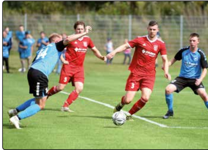
Fußballspiel im Stadion.