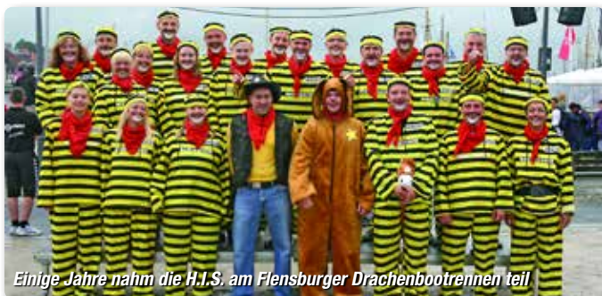
Einige Jahre nahm die H.I.S. am Flensburger Drachenbootrennen teil