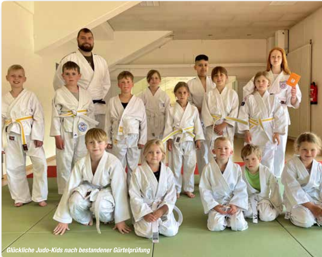
Glückliche Judo-Kids nach bestandener Gürtelprüfung