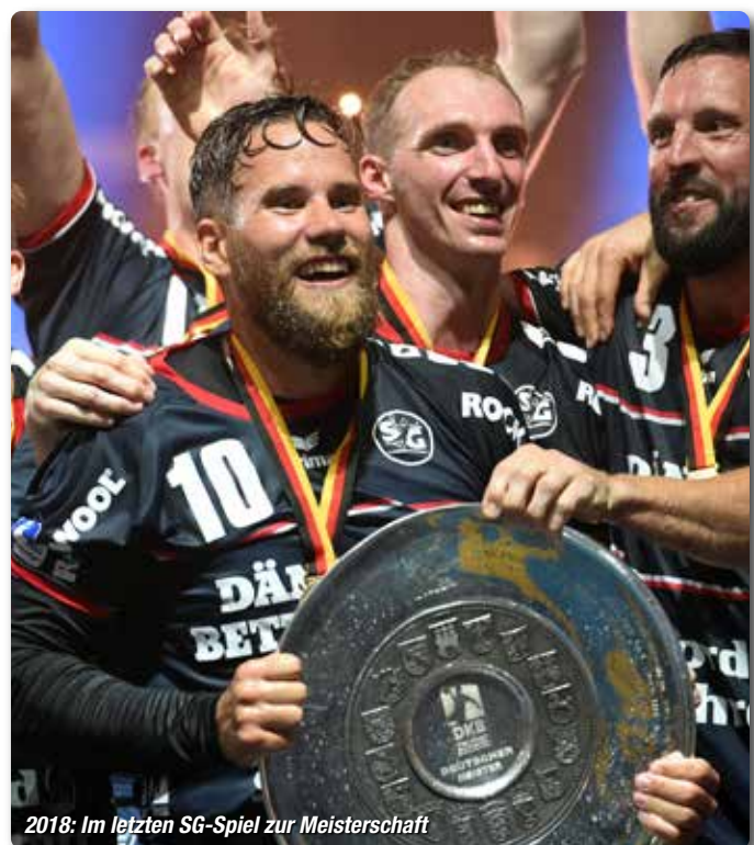
2018: Im letzten SG-Spiel zur Meisterschaft

Wiesharder Markt 23 · 24983 Handewitt · Fon 04608 608647