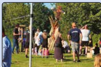
Nyt fra Hanved UF