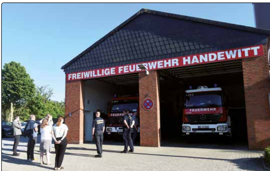
Besichtigungstermin am Handewitter Gerätehaus.

Im Normalfall ergeben sich die Investitionen in den Feuerwehr-Sektor aus einem speziellen Bedarfsplan. Der soll für die Gemeinde Handewitt, auf deren Territorium sich insgesamt fünf Ortswehren und zwei Jugendwehren befinden, neu aufgelegt werden. Derzeit werden die nötigen Daten mit einer speziellen Software gesammelt. Zu einem späteren Zeitpunkt soll ein unabhängiger Experte eingeschaltet werden. Der Feuerwehr-Bedarfsplan sollte eigentlich auf der jüngsten Sitzung des Finanz- und Wirtschaftsausschusses behandelt werden, wurde dann aber doch von der Tagesordnung genommen, weil Gemeindeführer Frank Thiel krankheitsbedingt fehlte.