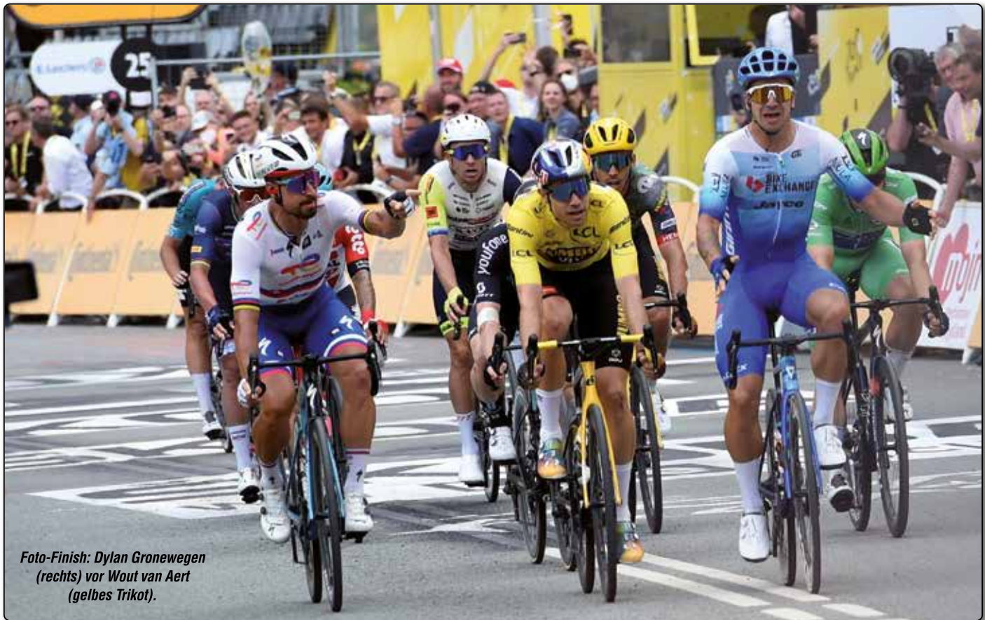
Foto-Finish: Dylan Gronewegen (rechts) vor Wout van Aert (gelbes Trikot).

Rot-weiß, Danish Dynamite! Die ersten drei Etappen der Tour der France versetzten ganz Dänemark in einen Zustand der Begeisterung. Das größte Radrennen der Welt startete in Kopenhagen mit einem Einzelzeitfahren, nahm dann Seeland