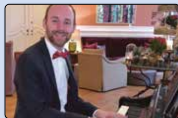
DRK - Bunter Nachmittag