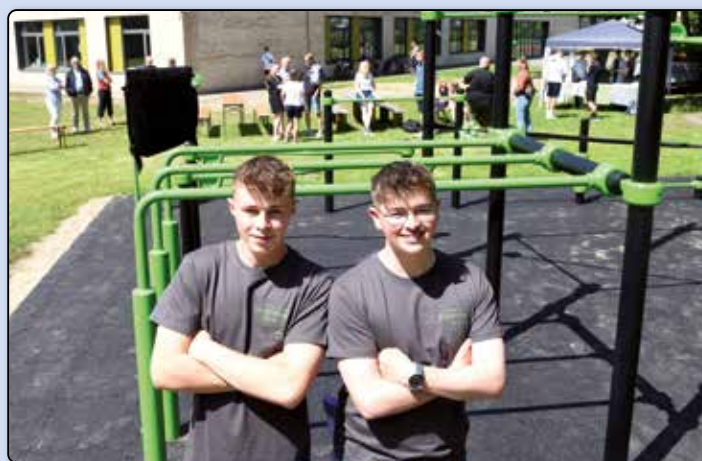
Siegfried-Lenz-Schule: Ein „Calisthenics Park“ für Handewitt