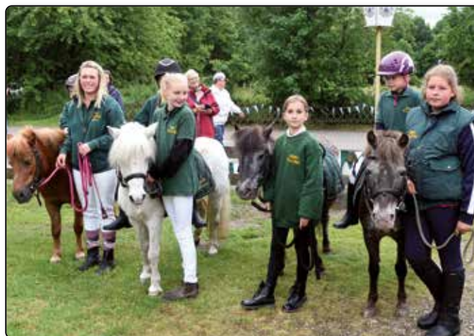
Die jüngsten Teilnehmer des Umzugs.