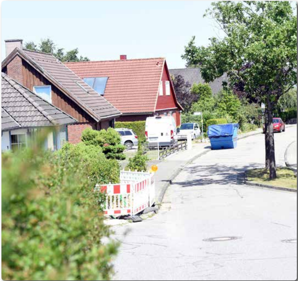
„Bürgerhilfe“ für die ganze Gemeinde?

rat meint: „Wohlwissend, dass dieses Beispiel über den ersten Ansatz der sozialen Bekümmernung älterer Mitmenschen hinausgeht, halten wir eine Bürger- oder Nachbarschaftshilfe für alle Einwohnerinnen und Einwohner der Gemeinde Handewitt als eine enorme soziale Bereicherung und echte Attraktivitätserhöhung.“ Wäre nicht ein runder Tisch diverser