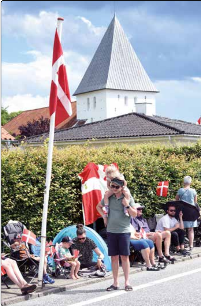
Sjölund: Warten auf das Feld.

auf 2022. Und damit rückte auch mein Tour-Debüt um ein Jahr nach hinten. Denn es war beschlossene Sache, dass ich mir den Rad-Klassiker nicht entgehen lassen würde, wenn die-