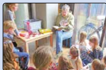
... wieder ist ein Schuljahr zu Ende