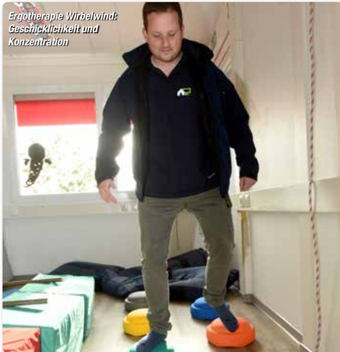
Ergotherapie Wirbelwind: Geschicklichkeit und Konzentration

Das war eine besondere Fahrrad-Tour. Zahlreiche Mitglieder der Handewitter Interessengemeinschaft Selbständiger (H.I.S.) schwangen sich auf ihre klassischen Fahrräder, ihre E-Bikes – und in einem Fall – sogar auf ein Einrad, um eines Abends sechs Firmen und Praxen zu besuchen. Start und Ziel dieser Gesundheits-Rallye, die schon vor zwei Jahren angedacht war, war der Wiesharder Markt.