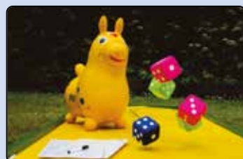
Spielmobil - Fahrplan