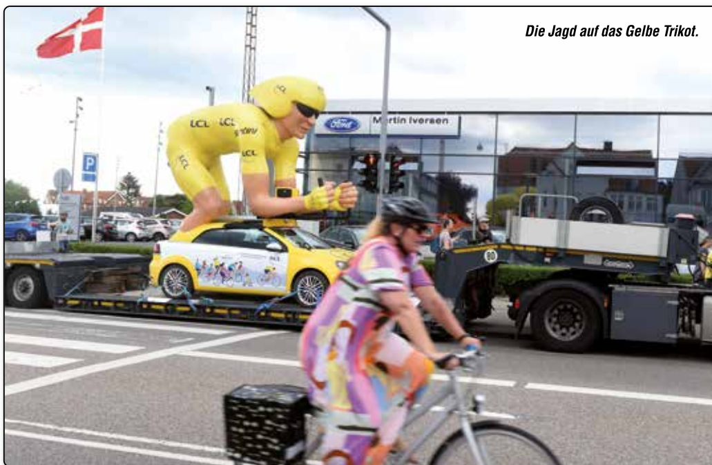
Die Jagd auf das Gelbe Trikot.

lund durchfuhr und das Bergtrikot verteidigte. Ich wechselte den Schauplatz. Als die Radrennfahrer 48 Kilometer nachhatten, nahm ich im Presse-Zentrum meine Akkreditierung in Empfang. Merci! Noch 25 Kilometer fehlten, als ich an den Team-Bussen im Zielbereich vorbeischnitt. Ab nun herrschte Maskenpflicht. Viele Profis fürchteten, wegen einer Corona-Infektion die dreiwöchige Tour vorzeitig beenden zu müssen. Mir wurde ein Foto-Platz mit 200 Meter Abstand zur Ziel-Linie zugewiesen. Zur Sicherheit aller, denn die Sportler kachelten die letzten Meter mit 70 Stundenkilometern herunter. Es war der erwartete Massenspurt. Am Ende hatte der Niederländer Dylan Groenewegen um Haaresbreite die Nase vorn. Das Gelbe Trikot, dem Besten im Gesamt-Klassement, verteidigte der Belgier Wout van Aert. Der Titelverteidiger Tadej Pogacar schlüpfte in das weiße Dress des besten Jung-Profis. Nach dem Transfer am nächsten Tag war die Tour de France wieder zu Hause – in Frankreich. Ohne mich. Mein einmaliger Absteher war aber ein Erlebnis. (ki) ■