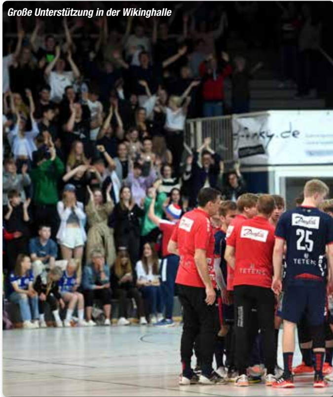
Große Unterstützung in der Wikinghalle