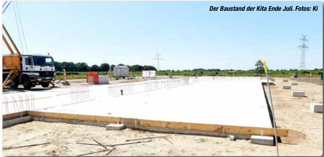
Der Baustand der Kita Ende Juli.

Gute Kunde kam aus Kiel: Handewitt erhält vom Land einen Zuschuss in Höhe von 480.000 Euro. Eine eher überraschende Nachricht, da der Fördertopf als völlig überzeichnet galt. Wegen des Investoren-Modells wird die Summe über die nächsten 30 Jahre auf den Gemeindeanteil der Betriebskosten gelegt. Voran geht es auch für die Häuslebauer. Im Juli wurden die knapp 50 Grundstücke für die Einfamilien- und Doppelhäuser verlost. Zwei Wochen später kam die letzte Asphalt-Tragschicht auf den Anne-Frank-Ring. In wenigen Wochen dürfen die Familien mit dem Bau ihres Eigenheims starten. Noch zu vergeben sind die Areale für die drei Wohnhöfe und die fünf Reihenhäuser. (ki) ■