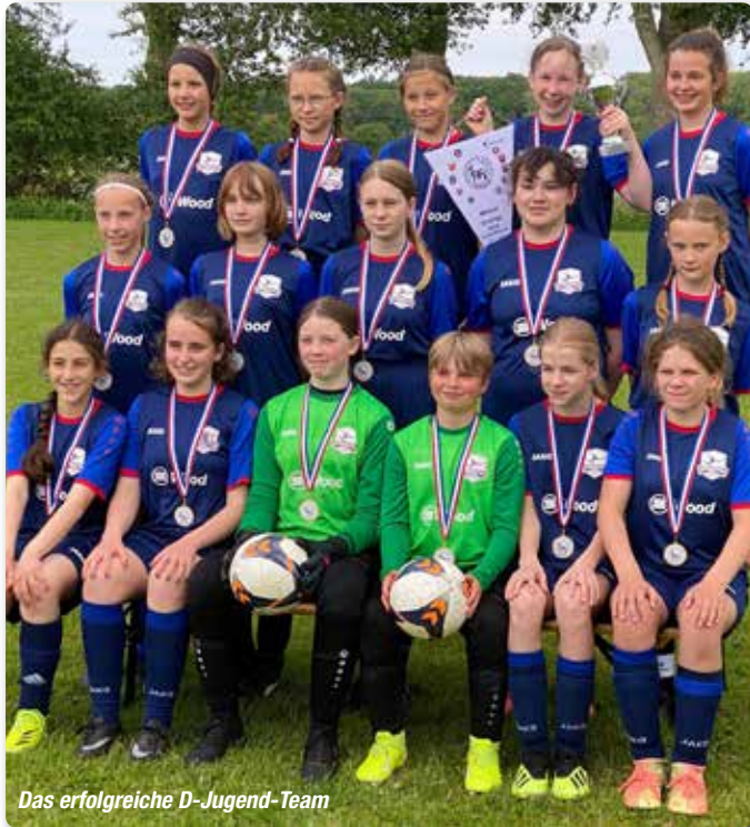
Das erfolgreiche D-Jugend-Team

Wechsel mit Handewitt stattfindet, vor. Die Vorbereitung auf die neue Saison begann Ende Juli. Der Zulauf an fußballbegeisterten Mädchen ist groß, sodass für den Spielbetrieb gleich mehrere Mannschaften in der fortgeführten SG Athletika Wiesharde gemeldet wurden. Wer Interesse hat, in einem Mädchen-Team Fußball zu spielen, meldet sich gerne beim FC Wiesharde.