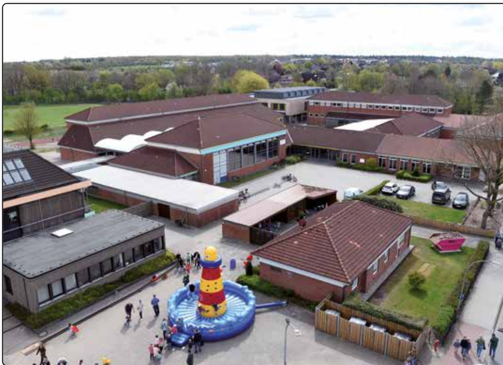
Der geplante Standort: Östlich hinter dem bestehenden Schulzentrum.

Letztendlich gingen zehn Entwürfe ein. Eine Jury bewertete diese an einem Tag und entschied sich für einen Vorschlag aus Berlin. Die vier „Blätter“ dienen als „Jahrgangshäuser“ und laufen in der Mitte zusammen, wo Mensa, aber auch Bewegungsangebote denkbar wären. Die Verbindungen zwischen den Räumen sollen so sein, dass schnell Einheiten unterschiedlicher Größe gebildet werden können. In Richtung der bestehenden Wikinghalle soll ein eigener Pausenhof für die Grundschule angelegt werden. Deren bisheriges Gebäude soll zukünftig im Erdgeschoss vom Jugendzentrum und der Offenen Ganztagschule genutzt werden. Darüber sollen die fünften und sechsten Klassen der Gemeinschaftsschule einziehen. Was kostet das Ganze? Eine Schätzung vom Februar ging von etwas über sechs Millionen Euro aus. Als nächstes wird das Sieger-Architekturbüro eine Kostenberechnung vornehmen. Nur mit eigenen Mitteln wird es nicht gehen, das weiß man in Handewitt. Gespannt wartet man auf die Förder-Programme für die Ganztagsbetreuung, mit der Zuschüsse aus Kiel und Berlin fließen sollen. „Wir werden den einen oder anderen Bundes- oder Landtagsabgeordneten einladen und unser Konzept vorstellen“, kündigt Marx Plagemann an. (ki) ■