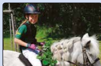
Neue Königin in Ellund