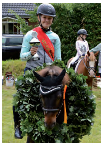
Die Königin beim Kinderringreiten

Nach zwei Jahren Abstinenz aufgrund der Corona-Pandemie und entgegen dem Trend anderer Dörfer wurde an der Durchführung des ansonsten bisher jährlich stattfindenden Sommerfestes festgehalten. Tagsüber meinte es das Wetter mit allen Beteiligten gut, denn es war trocken aber nicht zu heiß. Bei dieser Veranstaltung arbeiten der Ringreiterverein (Kinderringreiten), der Schützenverein (Preisschießen), das Rote Kreuz (Kaffee, Kuchen und Tombola) und der Gemeinderat (Radrिंगstechen und andere Spiele) eng zusammen. Der Aufbau des Festplatzes, Tortenspenden und hausgemachte Salate, alles musste organisiert und koordiniert werden. Und es hat wieder super geklappt. Nur die Temperaturen hielten sich nicht den ganzen Tag an die Abmachung, denn es kühlte aufgrund des lebhaften Windes zum Abend hin merklich ab. Die Teilnehmer des stattfindenden Kubb-Turniers hatten damit jedoch kein Problem, denn hier wurde so eifrig gespielt, dass es einem schon beim Zuschauen warm wurde. Sieger des Turniers wurde