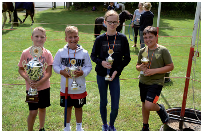
Die Sieger beim Radrिंगstechen