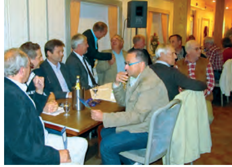
Das Foto wurde während der Informationsveranstaltung im Mai 2011 aufgenommen.

hohe Anschlussquote und das finanzielle Engagement unserer Gemeinde und insbesondere des Windparks bildeten das Fundament für den Erfolg. Natürlich sollen auch der Solarpark und die Biogasanlage nicht unerwähnt bleiben. Alle haben ihren Teil