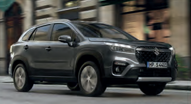
Abbildung zeigt aufpreisförmige Sonderausstattung