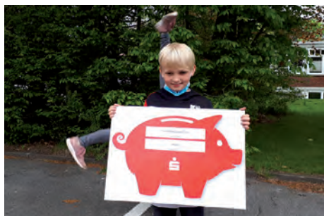
Jana ist entzückt und schlägt sogleich ein Rad!

Die Klasse 2 a hat am Wettbewerb „Deutsches Sportabzeichen“ teilgenommen und dabei nicht nur sportliche Erfolge erzielt. Unter den Teilnehmern wurden nämlich auch noch Geldpreise verlost. Ru-