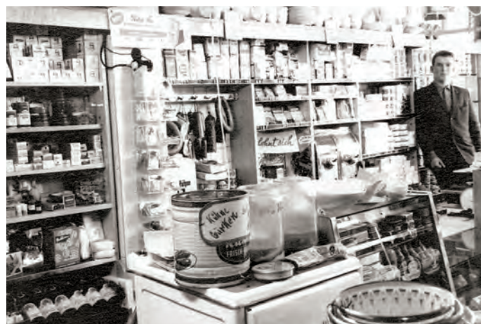
Bernd Kohls im Kaufhaus Kohls, bevor das Geschäft auf die andere Straßenseite zog und sich vergrößerte.

In in der kalten Jahreszeit roch es in den Viöler Wohnzimmern immer