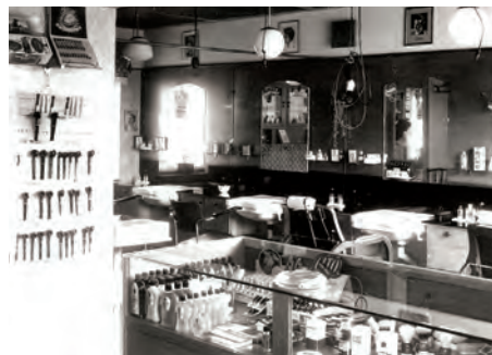
Im Salon Jessen zu kaufen: Haarshampoo, Haarwasser – und Pfeifen und Zigarren.

Vor Schulbeginn waren viele Schüler noch schnell auf einen Sprung im Schreibwarengeschäft Wobser. Die Mischung aus dem Duft von Schreibtinte, Süßigkeiten und ledernen Schulranzen