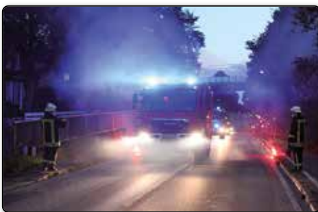
Ankunft des neuen Feuerwehrfahrzeugs (LF 10) der Freiwilligen Feuerwehr Weding am 16.09.2017