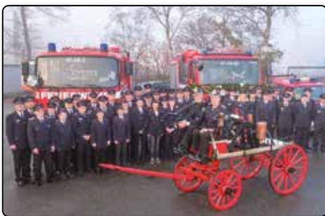
Festakt zur Fahrzeugübergabe am 25.11.2017

Wir möchten, die Freiwillige Feuerwehr in Weding über die Norm hinaus ausrüsten und dadurch die Effektivität in der Brandbekämpfung und der technischen Hilfeleistung steigern. Alle finanziellen Mittel, die der Verein zur Verfügung hat, werden für die Feuerwehr verwendet und so direkt zum Wohl der Bürger bereitgestellt, so die Initiatoren des Fördervereins. Wissen Sie eigentlich, dass die Feuerwehr viel mehr Aufgaben hat als nur Feuer löschen? Leben Retten, die technische Hilfeleistung und der Katastrophenschutz sind weitere Aufgabenfelder in unserer Feuerwehrpraxis.