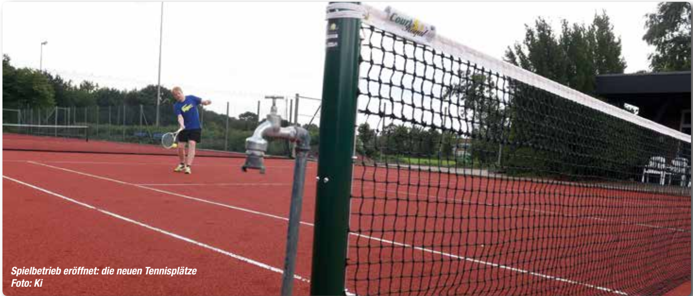
Spielbetrieb eröffnet: die neuen Tennisplätze

Diese Infrastruktur haben nicht viele Vereine im Norden. Zwei hochmoderne „Tennis-Force ES“-Plätze und ein Trainingsplatz gehören jetzt zur Infrastruktur des Handewitter SV. Das Revolutionäre ist der neue Belag, der einen ganzjährigen Betrieb ermöglicht. Auf jeden Fall wird von März bis November die Anlage spielfähig gehalten werden. Ein Winterevent unter dem Motto „Eisten-