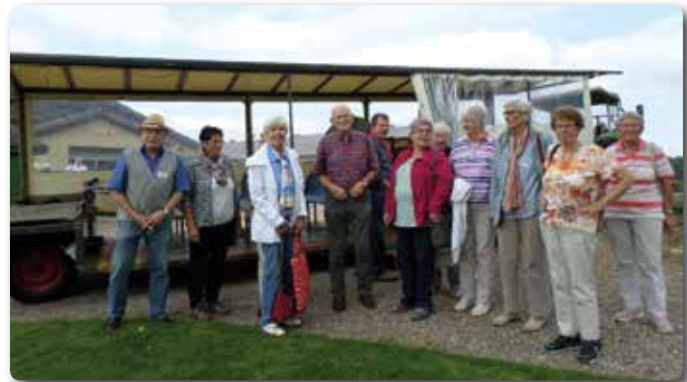
Mit dem Planwagen nach Bargen und dann mit der Fähre

Die zweite Gruppe fuhr zuerst durch die schöne Landschaft der Eider-Treene-Sorge-Region, auch mit dem Planwagen, um anschließend mit der Bargener Fähre zurückzufahren.