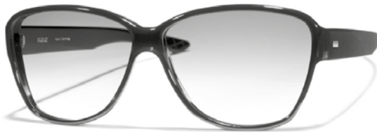
Modell „Schein“ von REIZ

Schein oder nicht Schein. Das ist keine Frage.