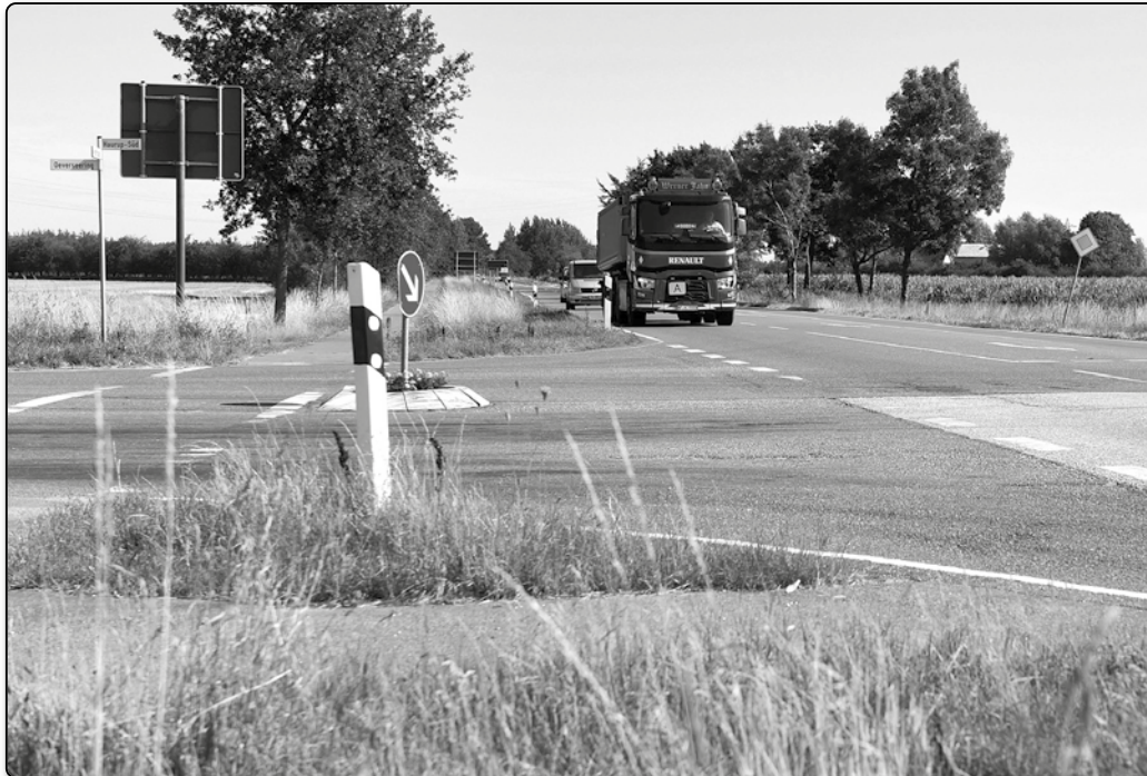
Die Kreuzung in Haurup-Hoffnung ist schon lange ein neuralgischer Punkt.

Die Situation in Haurup-Hoffnung, wo der Oeverseerring (L96) die Bundesstraße 200 kreuzt, lag den Kommunalpolitikern schon länger im Magen. Dort registrierte die Statistik drei