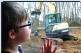
Neubau in der Kita