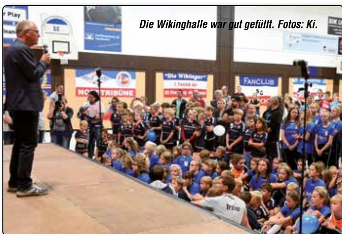
Die Wikinghalle war gut gefüllt.