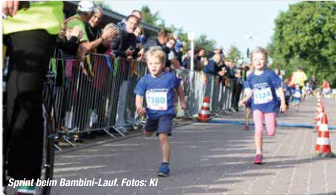
Sprint beim Bambini-Lauf.