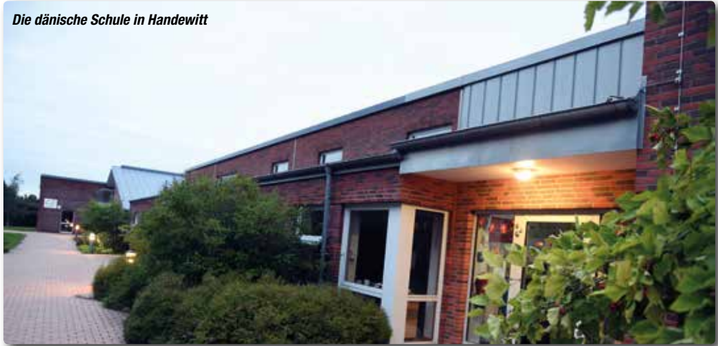
Die dänische Schule in Handewitt

GB GEBR. BECKMANN IHR PARTNER FÜR BAD & HEIZUNG