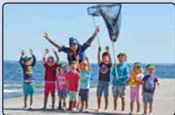
Ein toller Sommer