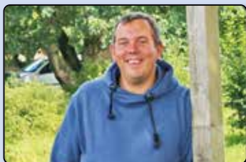
Neu im T.O.J.-Team