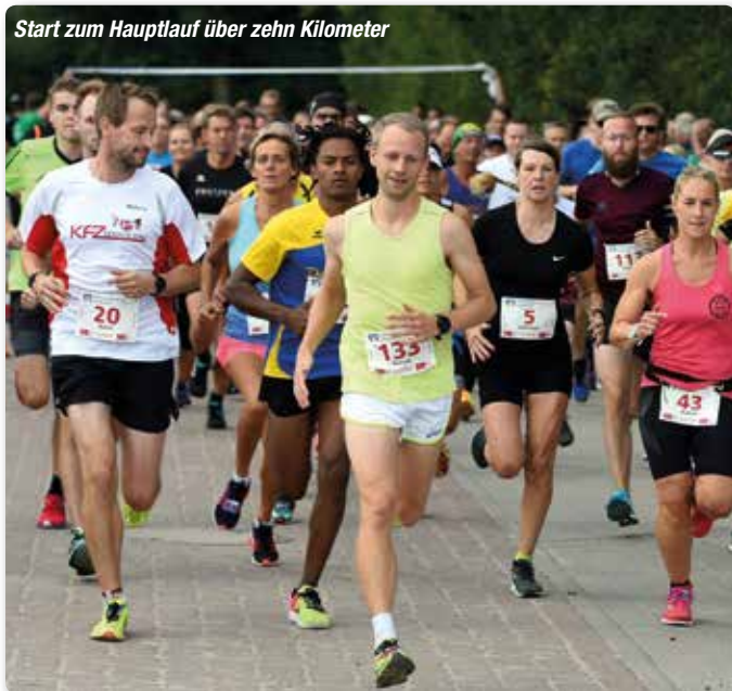
Start zum Hauptlauf über zehn Kilometer

einen Gartenschlauch um – zur Dusche im Dauerbetrieb. Unter dem Strich darf wieder ein positives Fazit für den Handewitter Sommerlauf gezogen werden. „Eine Super-Veranstaltung“, sagte Martin Rudolph, Vorstand der Raiffeisenbank Handewitt, und hob beide Daumen. Der Hauptsponsor verlängerte für die nächste Auflage am 1. September 2019. Auch die Gemeinde bleibt im Boot. Bürgermeister Thomas Rasmussen lief erstmals die 5000 Meter und landete im hinteren Bereich. „Ich bleibe dran und werde mich für das nächste Mal besser vorbereiten“, kündigte er an. (ki) ■