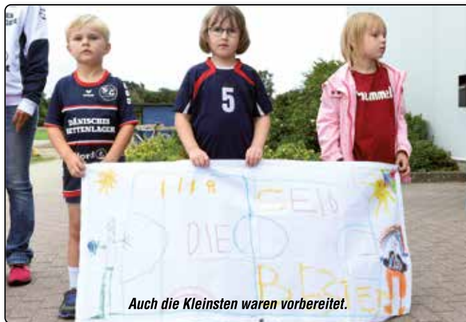
Auch die Kleinsten waren vorbereitet.

Um 17 Uhr postierten sich die Kleinen vom Handewitter ADS-Kindergarten vor dem Osteingang. Sie hatten einige Transparente entworfen: Mit „Super-Team“ und „Ihr seid die Besten!“ empfingen sie die SG-Profis, die im Innern einen Spalier, gebildet von den vielen jungen Handballern, durchschritten. „Da