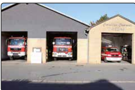
Der Fuhrpark der Freiwilligen Feuerwehr Weding