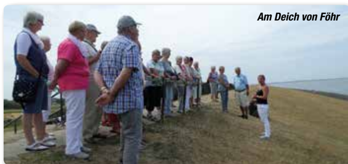
Am Deich von Föhr