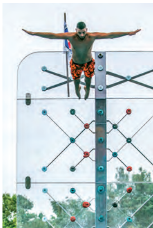
Platz 1 mit 566 Likes: Yusuf