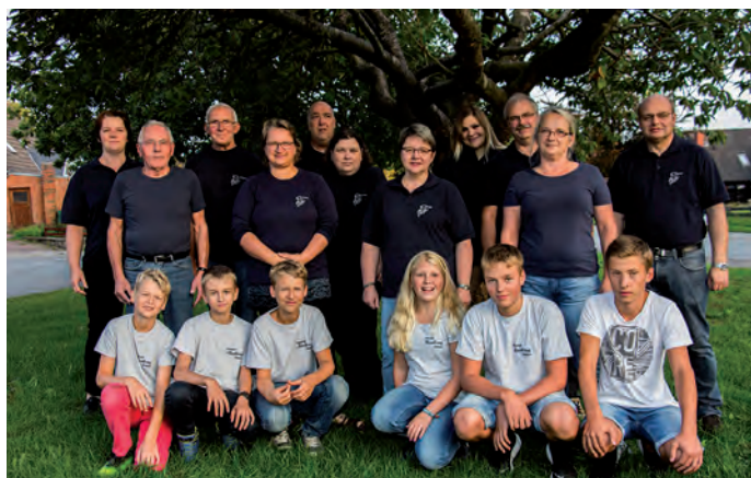
Feuerwehrmusikzug Bordelum mit dem jungen Nachwuchs „Halbprofis“

Am Mittwoch, den 8. August 2018 fand im Rahmen der Jugendarbeit ein gemeinsamer Übungsabend des Feuerwehr-Musikzuges Bordelum mit