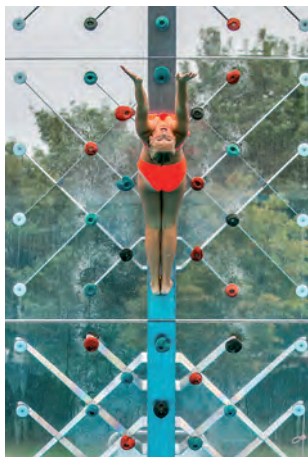
Platz 2 mit 460 Likes: Susanne