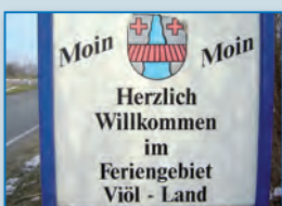
Seite 6 + 7