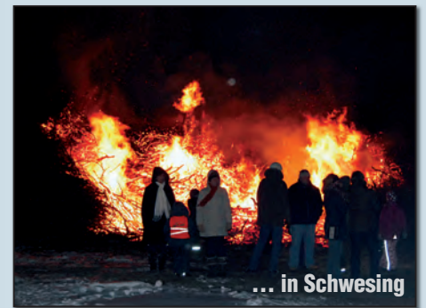
... in Schwesing