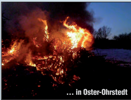
... in Oster-Ohrstedt