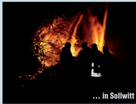
... in Sollwitt