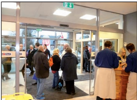
Kurz vor der Eröffnung

Das Adventspunsch des HGv's, der Schützengilde, der Feuerwehr und der Gemeindevertretung wurde trotz teilweise widriger Witterungsumstände so gut angenommen, dass in 2014 jeweils an den Adventswochenenden am Freitag wieder den Interessierten die Möglichkeit gegeben werden soll sich bei einem Punsch zum Klönschnack zu treffen. Damit hat dann der lebendige Adventskalender auch jetzt schon vier Termine besetzt.