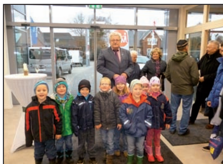
Der Ohrstedter Kindergarten trifft ein