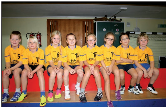
Mannschaft Ohrstedt I

spielten in verschiedenen Gruppen und waren an diesem Tag nicht vom Glück verfolgt: Ohrstedt II brauchte im letzten Spiel noch einen Sieg, um in das Halbfinale einzuziehen. Doch trotz spielerischer Überlegenheit wollte der Ball nicht in das Tor. Ohrstedt I begann in der Vorrunde mit fulminanten Siegen, doch dann fehlten in den nachfolgenden Spielen leider die Tore. So kam es dann überraschend zum Platzierungsspiel Ohrstedt I gegen Ohrstedt II, welches Ohrstedt II knapp mit 1:0 für sich entschied. Floorballkreismeister wurde die Utholm-Schule aus Garding vor der Grundschule Wyk. Platzierungen: Ohrstedt I 8. Platz, Ohrstedt II 7. Platz.