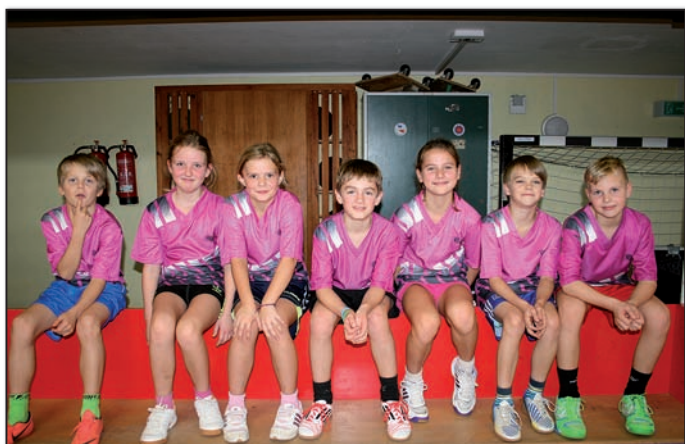
Mannschaft Ohrstedt II

Am 28.11.13 reisten 10 Kinder aus den 3. und 4. Klassen zur Futsalkreismeisterschaft (Hallenfußball mit leicht abgewandelten Regeln) nach Langenhorn. Gespielt wurde je 10 min jeder gegen jeden. Die Ohrstedter Jungs starteten gut in das Turnier mit einem Sieg und 2 Unentschieden. Doch leider ging ihnen im Entscheidungsspiel um den ersten Platz die Puste aus: 3:0 gewann Niebüll gegen Ohrstedt und wurde Turniersieger. Unsere Jungs nahmen den undankbaren 4. Platz mit nach Hause (siehe Foto oben).