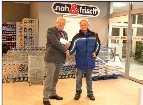
Der erste Kunde im MarktTreff