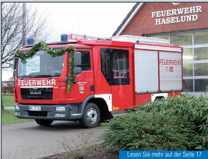
Lesen Sie mehr auf der Seite 17