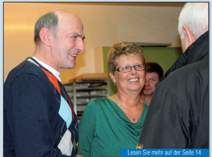
Lesen Sie mehr auf der Seite 14