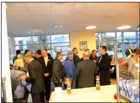
Die Eröffnung bei guten Gesprächen und tollen kalten Platten vom Kaufmann