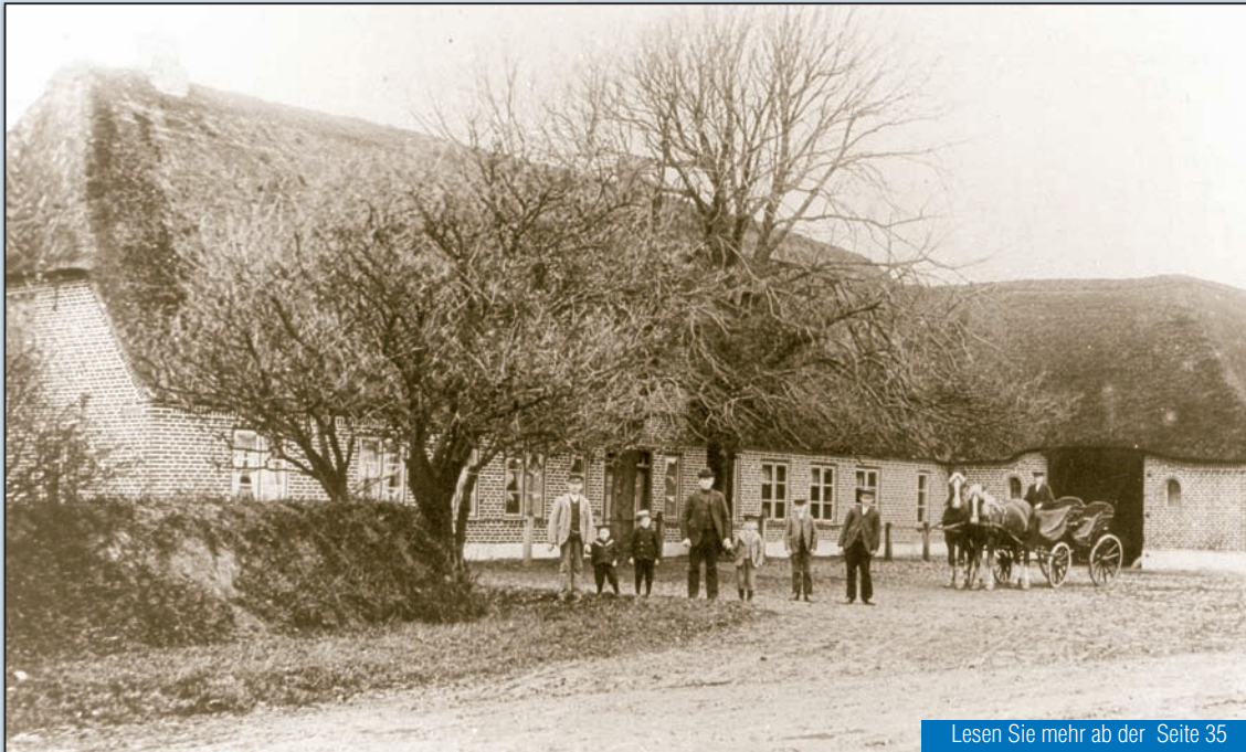
Lesen Sie mehr ab der Seite 35