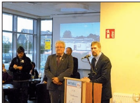
Auch der Bürgermeister unserer Kooperationsgemeinde wünscht alles Gute