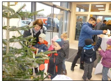
Nun wird der Baum geschmückt