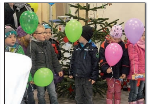
Die Kinder tragen etwas Weihnachtliches vor