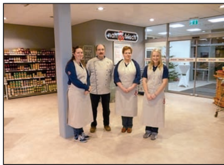
Jetzt kann es losgehen