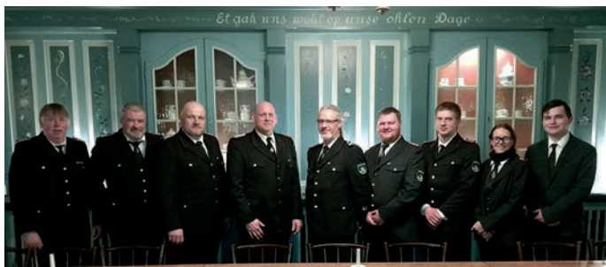
Die geehrten und in die Ehrenabteilung verabschiedeten Feuerwehrkameraden

Somit wird Vollstedt alleine einen Neu – oder Anbau in ihrer Dorfmitte planen.