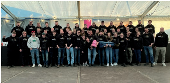
Das gesamte Team der Landjugend Reußenköge mit dem diesjährigem Osterrallye-Ei.

Am letzten Ostersonntag war es für die Landjugend Reußenköge endlich wieder so weit: die alljährliche Osterrallye und anschließende Fete wurden ausgerichtet.