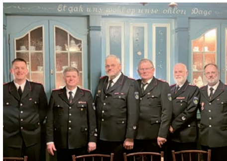
Die neu gewählte Feuerwehrführung