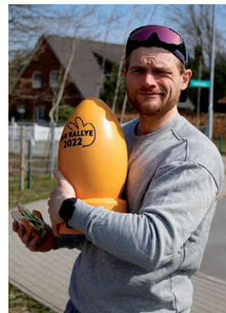
Das Gewinnerteam des letzten Jahres hoffte in diesem Jahr an ihren Erfolg anzuknüpfen.

ihre Rallye stecken, bekommen sie auch zurück. Viele versuchen jedes Jahr einen begehrten Platz zu ergattern und wenn es nicht klappt, sind die abends zur Fete dabei.