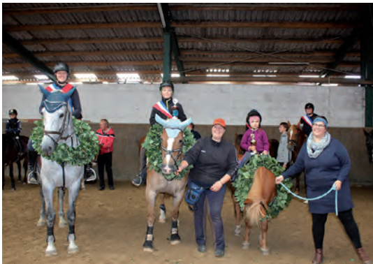
Die drei Könige Kinderringreiten