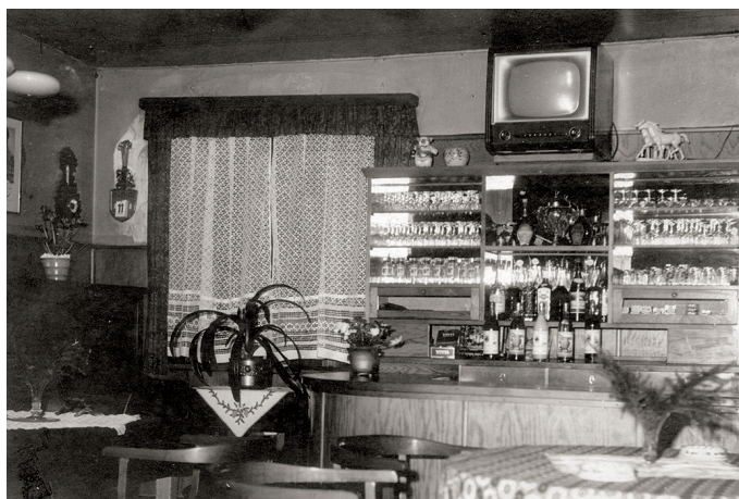
Schmuckstück und Zentrum der Schenkstube bei Hansches in Viöl. Der Fernseher, um den sich die Viöler Sportbegeisterten versammelten.

Die ersten Fernseher im Dorf waren in den fünfziger Jahren und auch in den frühen Sechzigern noch sehr rar gesät. Bei Fiekens stand einer und in der Bahnhofsgaststätte bei „Krögers Grete“. Auch auf Ackebroe hatte die Gastwirtschaft einen Fernseher. Die ersten Geräte hatten sogar noch eine förderliche Wirkung auf die Nachbarschaft. Sie waren eben so teuer, dass nicht jede Familie ein