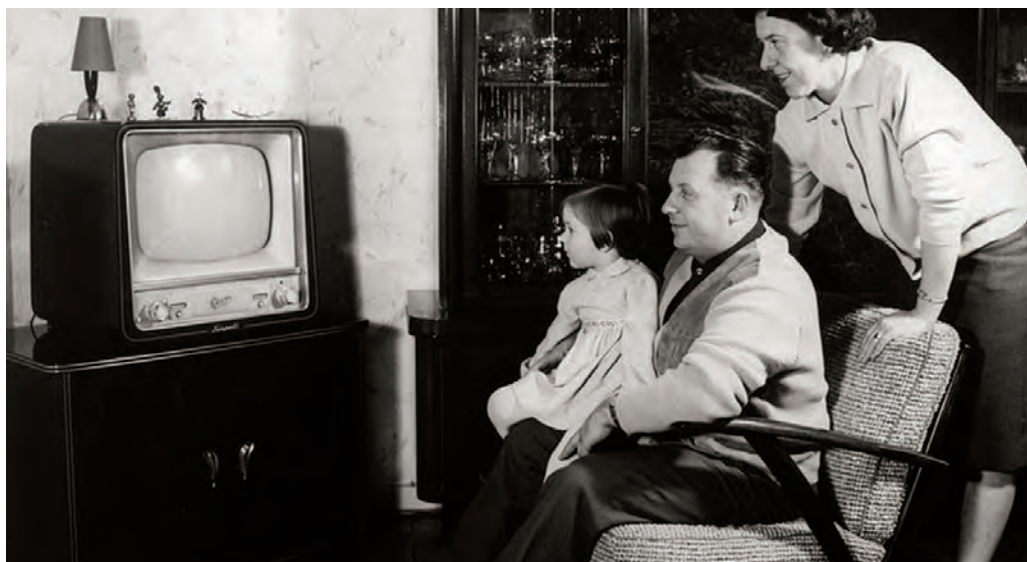
Auch wenn gerade kein Programm gesendet wurde, war ein neuer Fernseher in den fünfziger Jahren sofort Familienmittelpunkt.