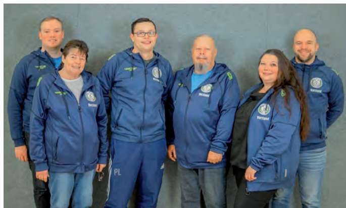
Der neue Vorstand

Auf dem Festplatz wurden unterdessen die verschiedenen Hüpfburgen von vielen Kindern in Beschlag genommen und Tombolose unter die Leute gebracht. In einem kleinen "Kreativzelt" wurden Kindergesichter mit Schminke in kleine Katzen und Schmetterlinge verwandelt, mit einer Buttonmaschine individuelle Buttons angefertigt und so manches Airbrush-Tattoo auf die Arme gesprüht. Wem der Sinn eher nach Ballsport stand, konnte sich beim TSV Viöl im Fußballdart testen oder beim Viöler TC den Tennisschläger ausprobieren.