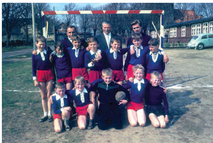
Die erste Jugendmannschaft des TSV Doppelreihe Viöl:

In der Handball-Kreisklasse Nordfriesland gab es natürlich auch Auswärtsspiele. Dabei kam das Eltern-Taxi zum Zug, denn zu den Spielen in Ostenfeld, Winnert, Bredstedt oder auch Husum und anderswo wurden Fahrer gebraucht. Also wurden die Spieler platzsparend auf mehrere PKW der Eltern aufgeteilt und zum Spielort gefahren. Trotzdem war das Team bei den Liga-Spielen oft auf sich allein gestellt, Eltern sind ja keine Trainer. Das bedeutete, dass nicht nach den Erfordernissen auf dem Feld ausgewechselt wurde, sondern nach in-