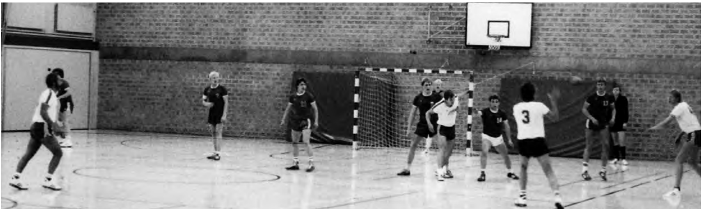
TSV Doppeleiche Viöl, etwas älter, circa 1980, aber wesentlich mehr Dynamik im Spiel

Es gab keine Handys in den Siebzigern, Hilfe kam so manches Mal