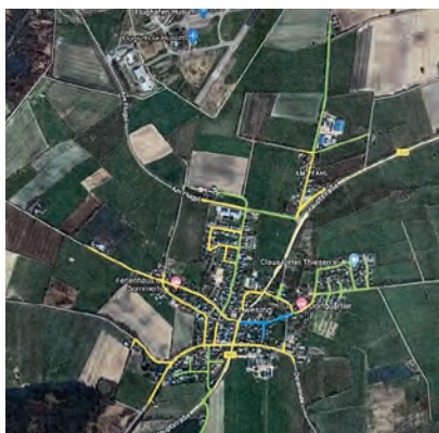
Grün: fertig incl. Hausanschlüsse/ Gelb: Leitungen fertig/Blau: im Bau

Lt. Zeitplan werden die Tiefbauarbeiten Anfang Oktober 2022 fertiggestellt sein – danach erfolgt die komplette Fertigstellung der Oberflächen in Absprache mit der Gemeinde.