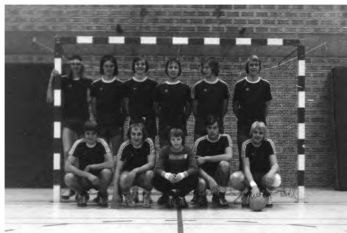
Jugend-Team in den 70er Jahren: