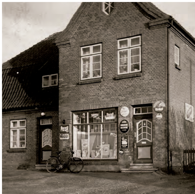
Gemischtwaren Runge in den 1950er Jahren

schickten einige Bauern Körbe mit Einkaufszetteln mit den Milchwagen zu Runges. Diese wurden bei Runges mit den gewünschten Waren gefüllt und später auf dieselbe Art und Weise zurückgebracht. Bezahlt wurde anschließend. Die Eckstocker kauften fast alle ihre Waren komplett bei Runges ein.