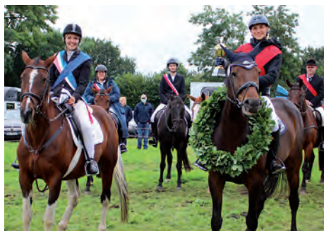
Feldführerin und Königin