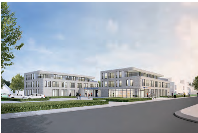
Visualisierung von den neuen VR Bank-Filialen samt Mietwohnungen im Herzen von Viöl. ©DL Architekten

Altersvorsorge, Baufinanzierung oder Vermögensberatung gegebenenfalls auch die ganze Familie dabei sein kann.