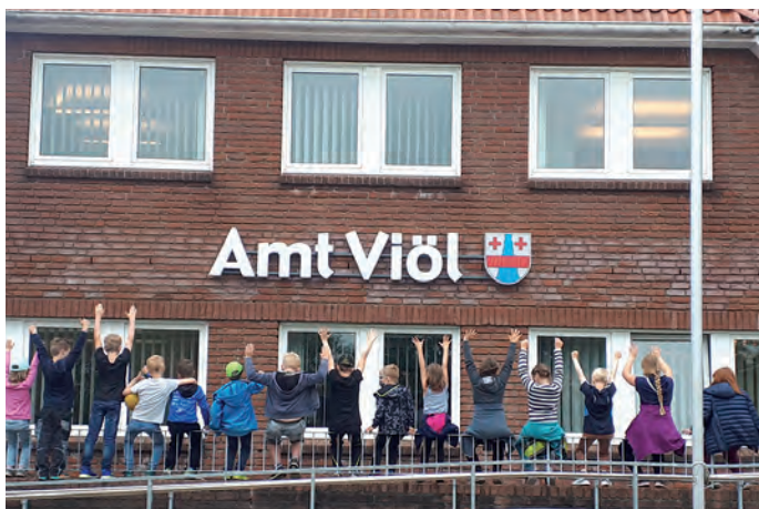
Kindern in der Ferienbetreuung von der Schule im Jugendzentrum

Die 7 Familienzentren in Nordfriesland werden gefördert vom Land Schleswig Holstein, Ministerium für Soziales, Gesundheit, Jugend, Familie und Senioren.