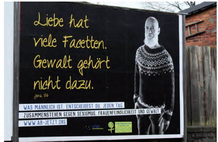
Auch mit großformatigen Plakaten, wie hier am Bredstedter Bahnhof, machen die Initiatoren des Aktionstags „Nein zu Gewalt gegen Frauen“ auf herrschende Missstände aufmerksam.

Weitere Hilfsangebote finden sich beispielsweise auf der Seite www.staerker-als-gewalt.de . Das Bundesministerium für Familie, Senioren, Frauen und Jugend informiert dort sehr breit zum Thema Gewalt und wie Betroffene oder auch Angehörige, Freunde und Nachbarn sich Unterstützung und Rat holen können. „Gewalt ist allgegenwärtig“, heißt es dort. „Zuhause, auf der Arbeit, im Netz“, überall