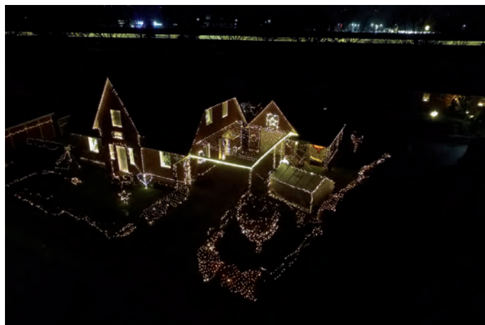
Allabendlich leuchten rund um Weihnachten unzählige Lämpchen am Haus der Gregersens.