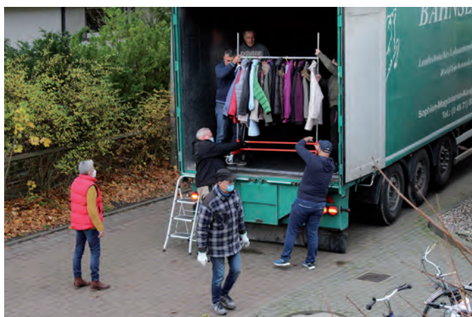
Der große Laster von BahnSEN Reh füllte sich nach und nach bis in den letzten Winkel.

Bekanntlich musste die gemeinnützige Kammer jüngst in ein „Winterquartier“ umziehen, weil das Gebäude am alten Standort im Krankenhausweg abgerissen wird. Als Zwischenlösung hatte sich das Gelände der „Neue Arbeit Nord“ angeboten. Dorthin wurde der Bestand der Kammer nun vorübergehend umgesiedelt.