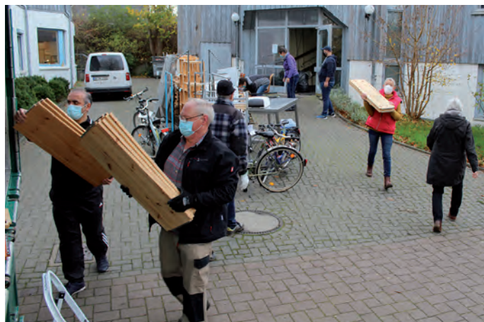
Rund 15 Frauen und Männer haben geholfen, den Lagerbestand der Spendenkammer zu verladen.