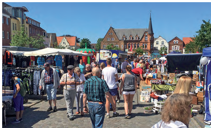
Mit zahlreichen Veranstaltungen rund um den Marktplatz beleben Stadt und HGV schon jetzt auch das Geschäftsleben in Bredstedt.

Zu den Schwächen zählen die Experten der Beratungsgesellschaft etwa die teils uneinheitlichen Öffnungszeiten im Handel. Es gelte, „verlässliches Einkaufen“ zu gewährleisten. Auch wird zu einer deutlicheren Spezialisierung in der Angebotspalette geraten, um sich „ein eigenständiges und unverwechselbares Profil zu geben“, so das Gutachten. Denkbar wäre eine stärkere Betonung auf Produkte der Region. Auch müssten Anreize für eine längere Verweildauer in Bredstedt geschaffen werden, beispielsweise durch Gastronomieangebote oder besondere Erlebnisse.