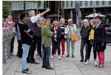
Die Tagestour als Dankeschön für ihr Engagement führte die Ehrenamtlichen nach Hamburg. Dort nahmen sie unter anderem an einer Führung rund um Hafencity und Speicherstadt teil.

50 bis 80 ehrenamtlich engagierte Bürgerinnen und Bürger zählen zum erweiterten Unterstützerkreis der örtlichen Flüchtlingshilfe. 20 von ihnen hatten die Einladung des AMNF angenommen. Unter ihnen auch ehemalige Flüchtlinge, die sich jetzt ebenfalls engagieren. „Wir freuen uns, auf diesem Weg einmal allen Dankeschön sagen zu können“, erläutert