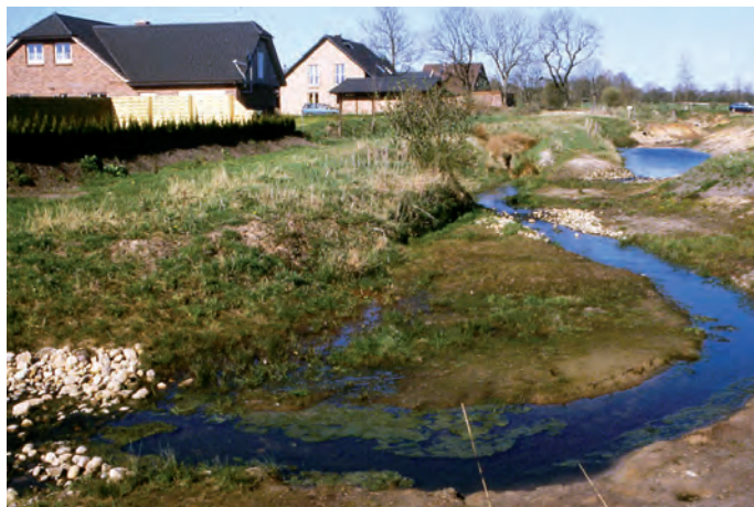
Die „Drelse“ am Mittelweg im Jahr 2001

Nach Ausschreibung erhielt die Firma „Peters und Söhne“ aus Nor-