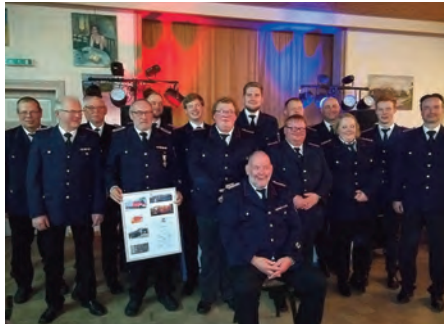
Ehrungen und Beförderungen

Am vergangenen Samstag stand in Ockholm wieder das traditionelle Jahresfest der Freiwilligen Feuerwehr an. Im Gasthaus „zur Mühle“ wurde dies im vollen Saale (70 Personen) ausgiebig zelebriert. Geprägt war der Abend von ganz besonderen Ehrungen.