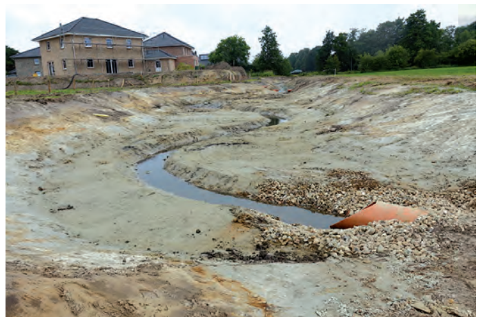
Rohröffnung östlich vom Westerweg im Jahr 2018