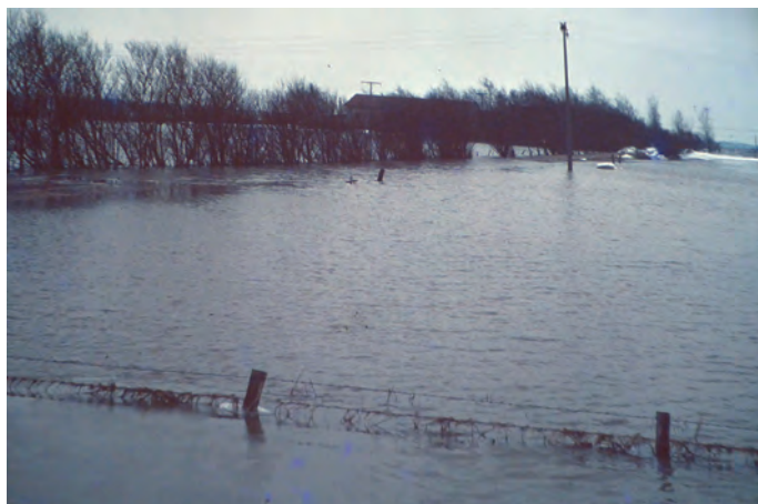
Überschwemmung bei der Arlau- Engje-Brücke

Auszüge aus der Bohmstedt Dorfchronik, Heft 3, geschrieben von Paul-Johann Feddersen