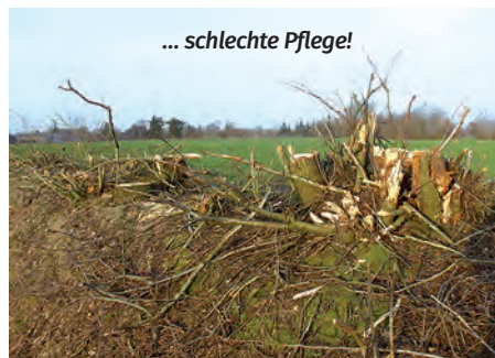
... schlechte Pflege!

Menschen nicht jedenfalls ein paar Gewürzkräuter in ihre Gärten. Die machen kaum Arbeit, sind aber für uns so hilfreich? „Der Vogel klagt: „Wohin ich geflogen bin, waren die Hecken durchge-