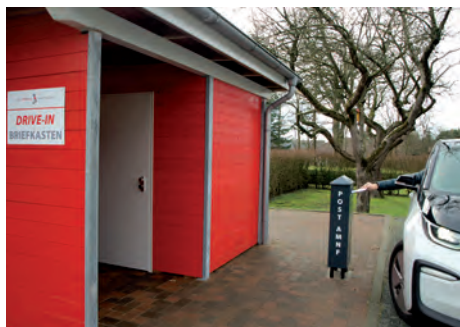
Auf der Rückseite der Amtsverwaltung in der Theodor-Storm-Straße steht ein neuer Briefkasten zur Verfügung.

Bredstedt. Mit einem „Drive-in“ Briefkasten auf der rückwärtigen Seite des Amtsgebäudes möchte die Verwaltung ihren Service noch bürger*innenfreundlicher gestalten. Dort lässt sich Post jetzt ganz einfach aus dem Fahrzeug heraus