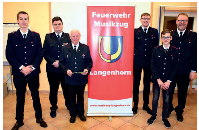
Die geehrten Mitglieder des Feuerwehrmusikzuges Langenhorn.

Auf der Jahreshauptversammlung wurden auch verdiente Musiker