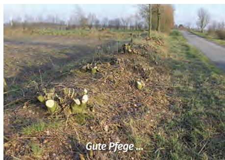
Gute Pflege ...

„Monotone Rasenflächen, exotische Gehölze, zu wenig Blühpflanzen, ausgeräumte Knicks ohne Knospen, viel zu oft ist es ausgeräumt und strukturlös. Die Biene fragt: „Warum pflanzen die