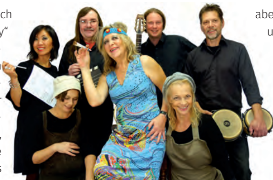
Die „frontFRAUENfront“ sind Sängerinnen, Musikerinnen und Musiker sowie Tontechniker.

Bredstedt. Anlässlich des „equal pay day“ laden die Gleichstellungsbeauftragten Nordfrieslands gemeinsam zu dieser Revue am Sonntagabend, 16.03.2019, ein. Auf der Bühne des Bürgerhauses präsentiert dann ab 18 Uhr die „frontFRAUENfront“