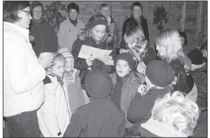
Kinder trugen Weihnachtsgedichte und -lieder vor.

Trotzdem erst ein Blick zurück auf 2009: Der Löwenstedter Sportverein hat wieder ein sehr aktives und erfolgreiches Jahr hinter sich gebracht. Beim Reitclub Blau-Weiß Löwenstedt liefen wieder diverse Veranstaltungen mit gutem Erfolg. Zuletzt zeigten sich viele Aktive und Zuschauer beim traditionellen Adventsturnier in den Löwenstedter Reithallen. Über ein gute Beteiligung freut sich das wöchentliche Kinderturnen im Kindergarten im Dorf. Unproblematisch und mit gutem Erfolg laufen auf die Damengymnastikkurse in Zusammenarbeit mit dem TSV Haselund und dem TSV DE Viöl. Inter-