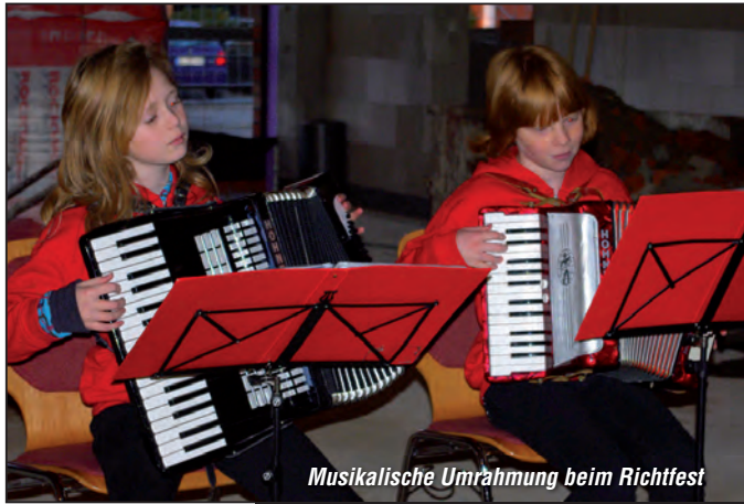
Musikalische Umräumung beim Richtfest

Sicher hatte man dabei nicht absehen können, welch große finanzielle Anforderungen auf die Schulträger zukommen würden; denn durch den radikalen Systemwechsel zum längeren gemeinsamen Lernen und zur Offenen Ganztagschule sind völlig neue Bedürfnisse entstanden: Und auch die Konkurrenz schläft nicht! Ich meine damit die benachbarten Schulträger!