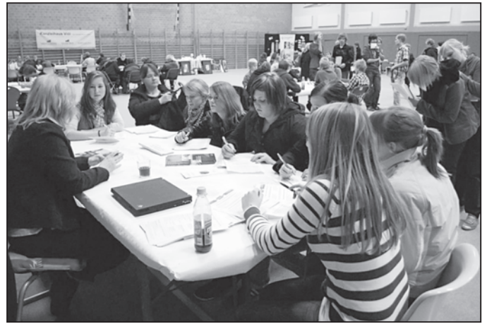
Intensive Gespräche am Stand

Eine anschließende Auswertung ergab, dass sowohl die Vertreter der Betriebe als auch Schüler und Eltern mit dem Angebot und Verlauf zufrieden waren. Aylysa Katzmarek/Ginzel