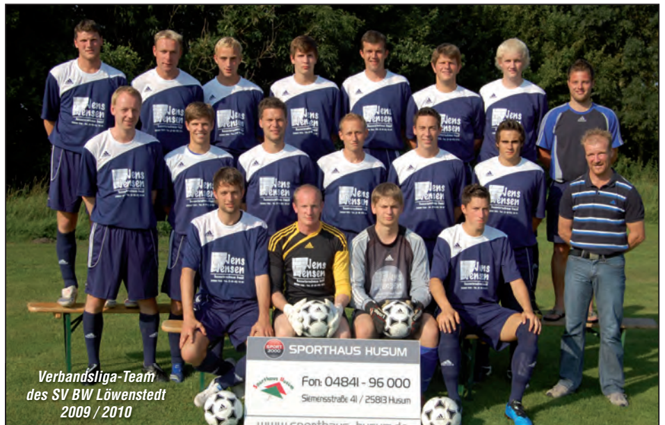
Verbandsliga-Team des SV BW Löwenstedt 2009 / 2010

Kinderfasching des SV BW Löwenstedt / TSV Haselund am 28.02.2010, 15-18.00 Uhr in der Gastwirtschaft Friedensburg., Fussball-Spartenversamm-