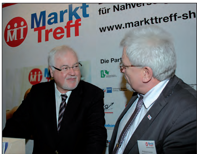
Auch der Ministerpräsident interessierte sich für unser MarktTreff-Projekt.

keit bei einer Podiumsdiskussion zum Thema Dorffinnenerneuerung unser Kooperationsmodell beider MarktTreff's zu präsentieren.