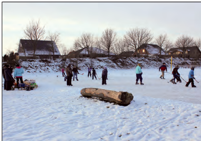
Bis im nächsten Winter selber Ort selbe Zeit....

Das Wetter zeigte sich in den kommenden Tagen sehr wintersportfreundlich, sodass die Eisfläche rege von Eisprinzessinnen und Prinzen genutzt wurde. Beim Eishockey lieferten sich die Kinder turbulente Spielchen gegen die Erwachsenen. Nach den ersten Ermüdungserscheinungen konnte man sich auf den Sitzgelegenheiten ausruhen um sich dann nach einer selbst mitgebrachten Stärkung aufs Neue ins Getümmel zu stürzen.