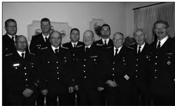
Der Vorstand und die Geehrten der Feuerwehr